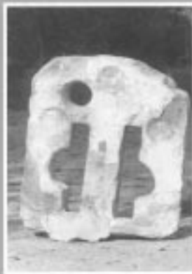
Mungia'ko San Anton Bateleizan.